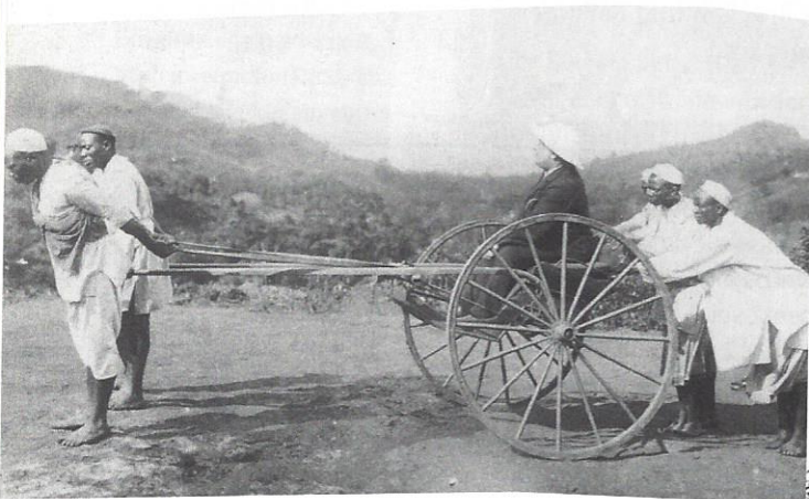
Ein Reichsabgeordneter in der Kolonie Deutsch-Ostafrika, 1906

„Einen Platz an der Sonne“ wünschte sich Kaiser Wilhelm II. Er meinte damit: Deutschland sollte Kolonien in aller Welt gründen. Zu der Zeit hatte bereits ein Wettlauf unter den europäischen Staaten um Kolonien begonnen. Um die Jahrhundertwende waren fast ganz Afrika und Südostasien unter den europäischen Staaten aufgeteilt. Die Spannungen unter den europäischen Mächten wuchsen. Wie kam es schließlich zum Ersten Weltkrieg? Welche politischen und gesellschaftlichen Folgen hatte er?