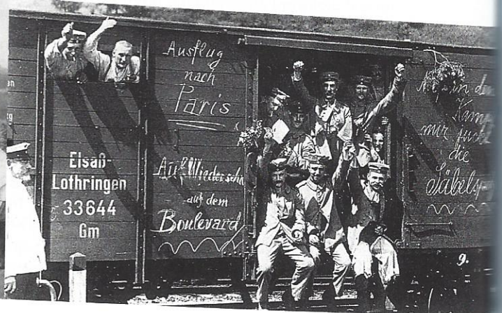
Deutsche Soldaten fahren an die Westfront, 1914